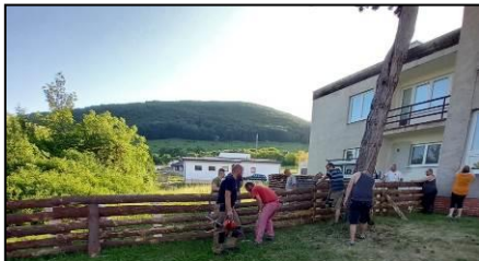
Stavba oplotenia pre ovce.