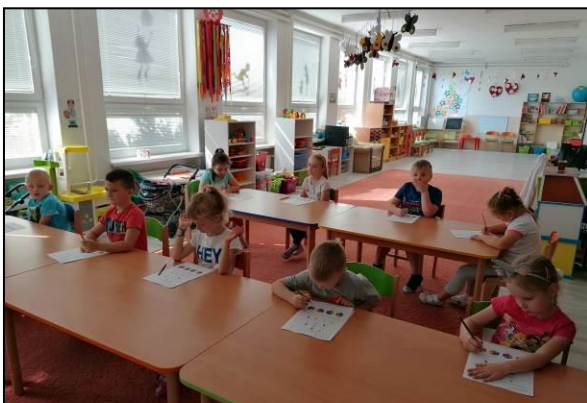
Vypracovávanie úloh logickej olympiády.

Všetkým deťom patrí pozitívne ocenenie, pochvala. Disciplinovanosť, samostatnosť, snaživosť, pozornosť vládli pri