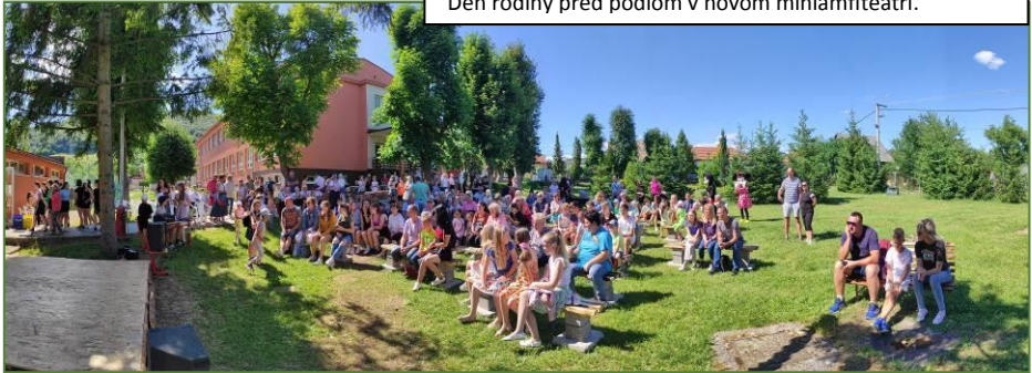
Pohľad na prítomných počas udalosti Deň rodiny pred pódium v novom miniamfiteátri.

V našej škole skrsla myšlienka spojiť rodinu a školu a vznikol nápad založiť tradíciu nového podujatia pri príležitosti Dňa rodiny. Veď rodina si zaslúži byť v centre pozornosti, pretože žijeme v dobe neskončenej pandémie a stále pretrvávajúcej vojny na Ukrajine.