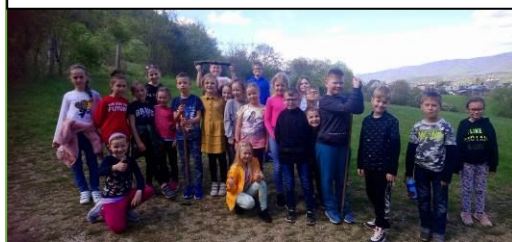
Deti v prírode pri čistení studničiek.

rôznych materiálov a rôznymi technikami. Okrem toho sa deti venovali čítaniu, písaniu a domácim úlohám. Nechýbal ani pohyb na čerstvom vzduchu. Deti najradšej trávili čas na detskom ihrisku a páčili sa aj vychádzky po okolí. Vonku sa hrali loptové hry, skákali gumu, na švihadlách, deti si stavali svoje domčeky. Preliezky a hojdačky boli vždy obsadené. Deti sú v klube spokojné, čo nás vychovávateľky teší a motivuje hľadať ďalšie spôsoby na zlepšenie kvality pobytu. -rh, -ak-