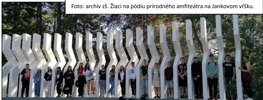
Žiaci na pódiu prírodného amfiteátra na Jankovom vršku.

V Uhrovci navštívili rodný dom Ľ. Štúra a A. Dubčeka, kde sa dozvedeli mnoho zaujímavostí zo slovenských národných dejín. –sš-