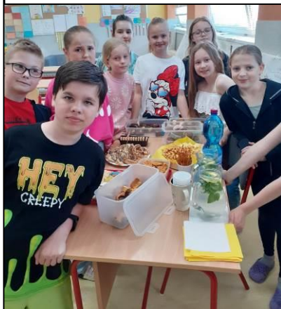
Nachystané občerstvenie k prezentácii prečítanej knihy.

V apríli tohto roku mala 150. výročie narodenia. Žiaci popri čítaní premýšľali nad zadanými úlohami. V piatok 27. mája počas čitateľskej párty predstavili knihu, svoje dojmy a zarecitovali spamäti báseň podľa vlastného výberu. Aj by knihy odporučili, ale aj nie kvôli zastaraným výrazom. Názory po prečítaní sa môžu rôzniť, tak je to správne. Podstatné je, že žiaci sa navzájom rešpektovali pri prezentácii, oceňovali a občerstvovali. Všetkým všetko z «občerstvovacieho» stola chutilo. Za prípravu dobrôt maminám ďakujeme. -jh-