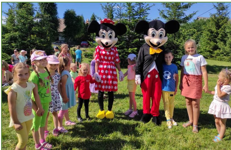
Nultý ročník osláv Dňa rodiny v školskom areáli.