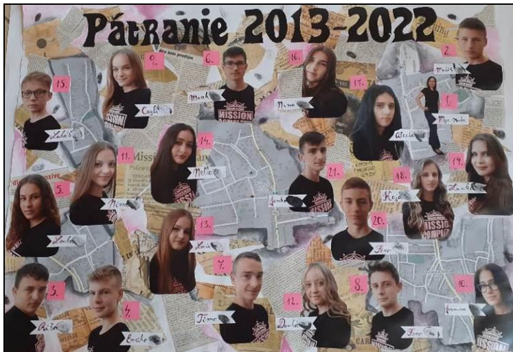
Deviatacke tablo.