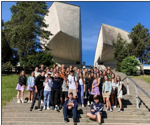
Žiaci pred Pamätníkom SNP v BB.