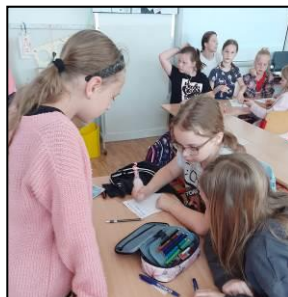
Štvrtáci hodnotia.