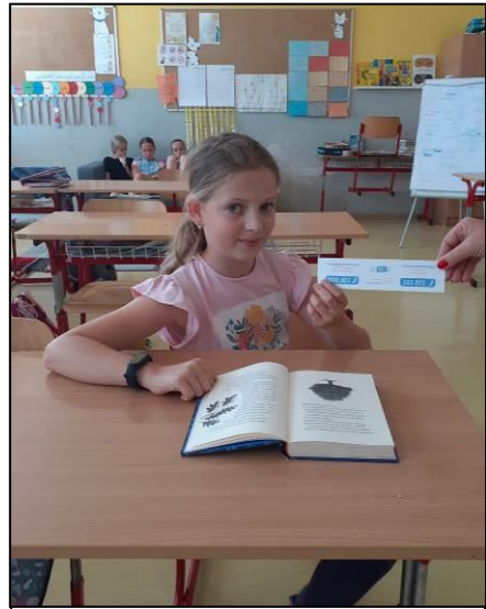
Linka detskej istoty (číslo získali deti na záložke) obnovila Čitateľský maratón. Zapojilo sa do neho 125 žiakov. Čítalo sa v slovenskom, ruskom, nemeckom i anglickom jazyku.

Ježko a pranie Redakčná rada praje po úspešnom ukončení školského roka oddych a príjemné dovolenky strávené pobytmi aj mimo domova všetkým zamestnancom školy. Žiakom praje - užite si prázdniny v radosti, pri dobrom zdraví a aj v spoločnosti dobrých kníh. Cez prázdniny sa snažte zažiť veľa zábavy, dobrodružstva, objavujte krásu a múdrosť kníh.