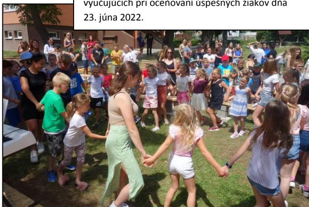
Spontánne tancovanie žiakov a vyučujúcich pri oceňovaní úspešných žiakov dňa 23. júna 2022.

Oceňovanie úspešných žiakov v novom mini-amfiteátri Všetci úspešní žiaci si užili chvíľku slávy na novom pódiu. Vyhodnocovali sa žiaci, ktorí si vo svojom voľnom čase vzali knihy do ruky,