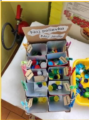
Štuplíkovacia anketa.

Medzi top jedlá sa zaradili: dukátové buchtičky, kuracie mäso na smotane s cestovinou, langoše so syrom a kečupom, soté z kuracích prs s ryžou.