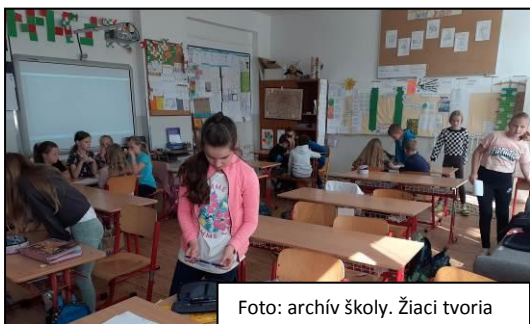
Žiaci tvoria ilustráciu k textu v skupinách.

Zaujímavé bolo kritické štvrtácke zistenie pri prezentácii: informácie v opise poskytli nepresne, nepopísali správne rozmiestnenie, tvar vecí, nabudúce chcú vytvoriť presnejší opis... Ocenili tretiačku zanietenosť, vystihnutie detailov i to, že prvý pokus si zaslúži veľkú pochvalu. Tretiaci pochválili nápad! Vyjadrili radosť z práce, ocenili štvrtácke prejavy podpory pri tvorení, povzbudivé slová, no i silu neprezradiť aká je skutočná