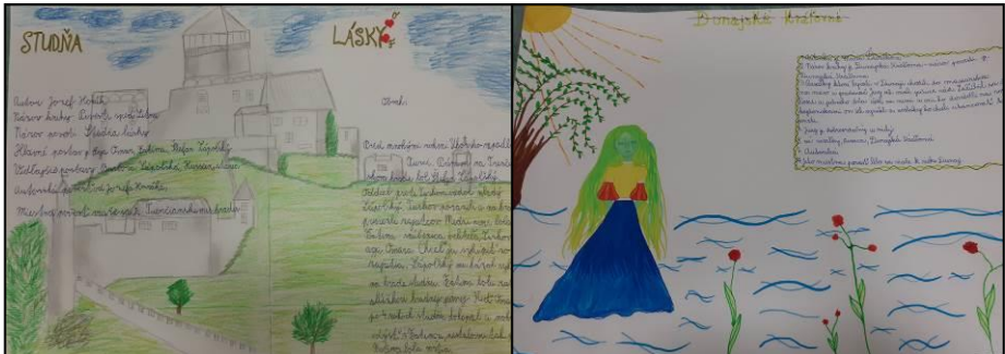
Spracovanie povesti Studňa lásky. Maroš Kohút, V. A