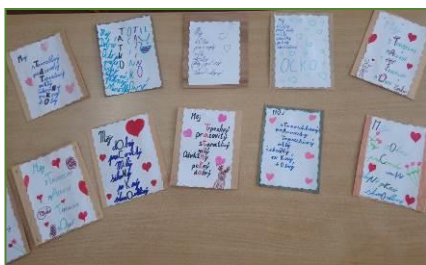
Tvorivosť a hry detí v ŠKD na rôzne témy.