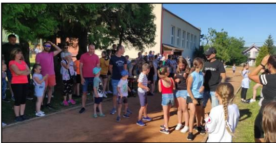
Rýchle Diviaky – bežci na štarte povzbudzovaní divákmi vo veľkom počte.

zameraná na rozvoj silových schopností bola súčasťou tradičnej súťaže Všetko za minútu. Ďalšia aktivita Rýchle Diviaky preverila rozvoj rýchlostných schopností, uskutočnila sa počas Dňa rodiny. Zapojilo sa do nej 101 bežcov (žiacov, učiteľov